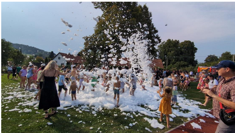
Hasičská pěna a radost dětí na sportovním areálu