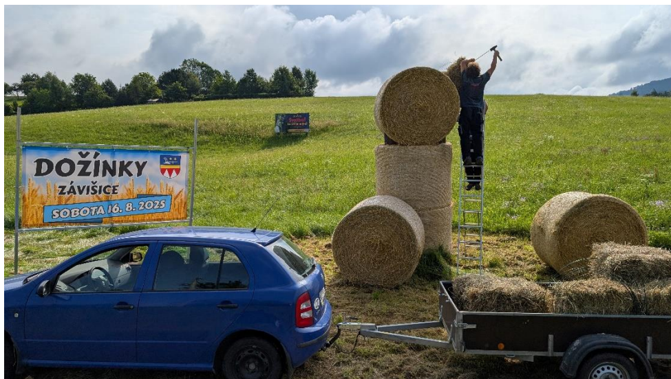
Příprava slaměných poutačů - medvídek