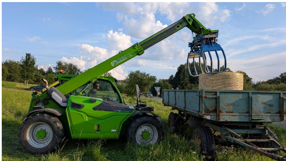
Příprava slaměných poutačů

Někteří z vás s námi být nemohli, jiní třeba jen na chvíli – o to víc vás zveme k prohlédnutí fotek a k zavzpomínání, jak krásně jsme se letos měli :-)