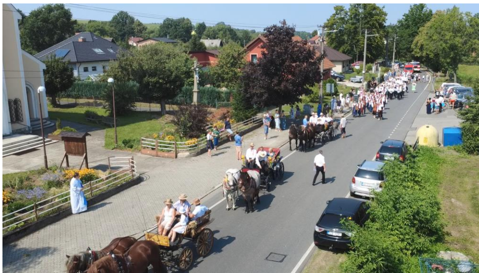
Průvod před Kostelem sv. Cyrila a Metoděje