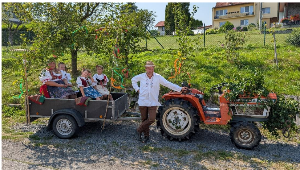
Chvilka klidu ve stínu těsně před vyjetím