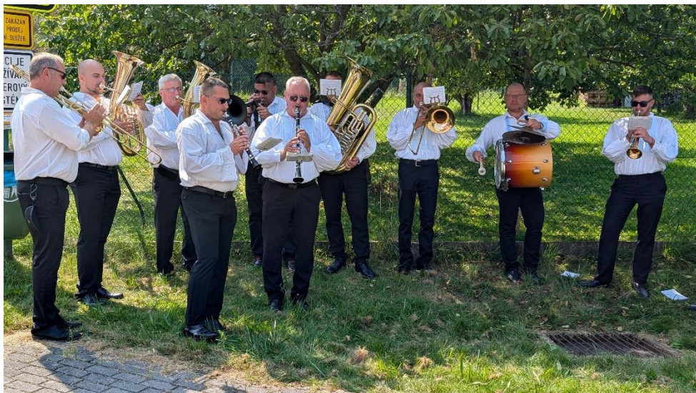
Naladit se na stejnou notu