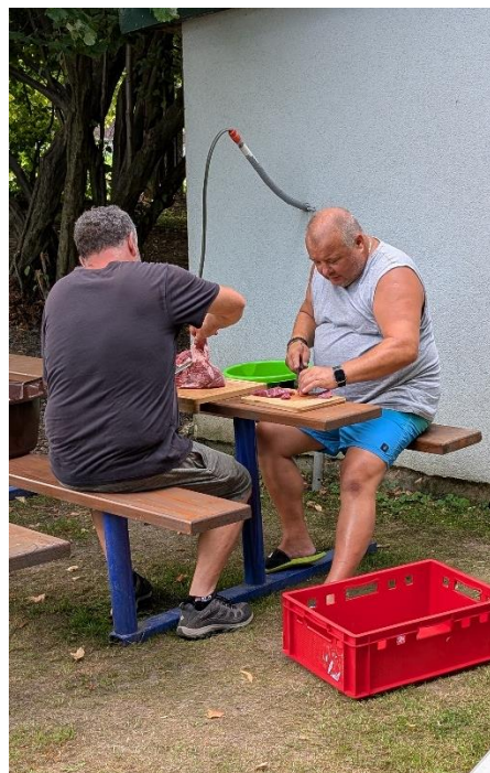
Opět hasiči – smaží se cibulka a krájení masa na guláš