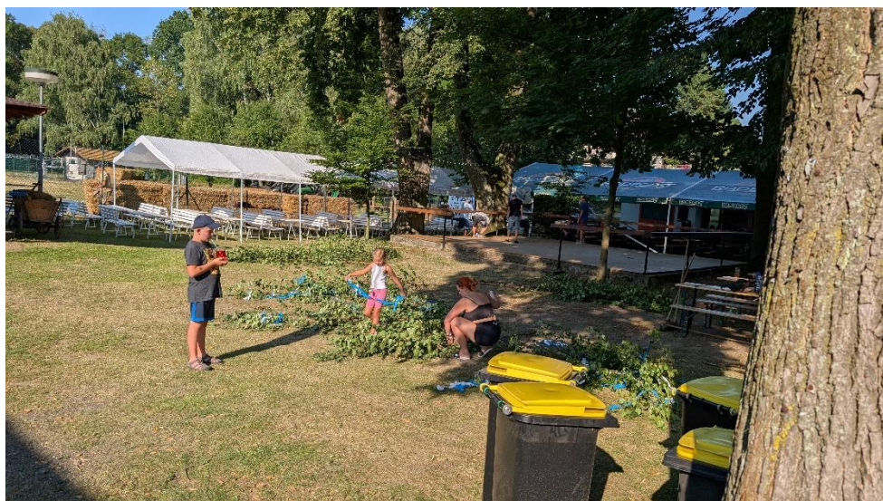
Výzdoba výletišť U Kremlů