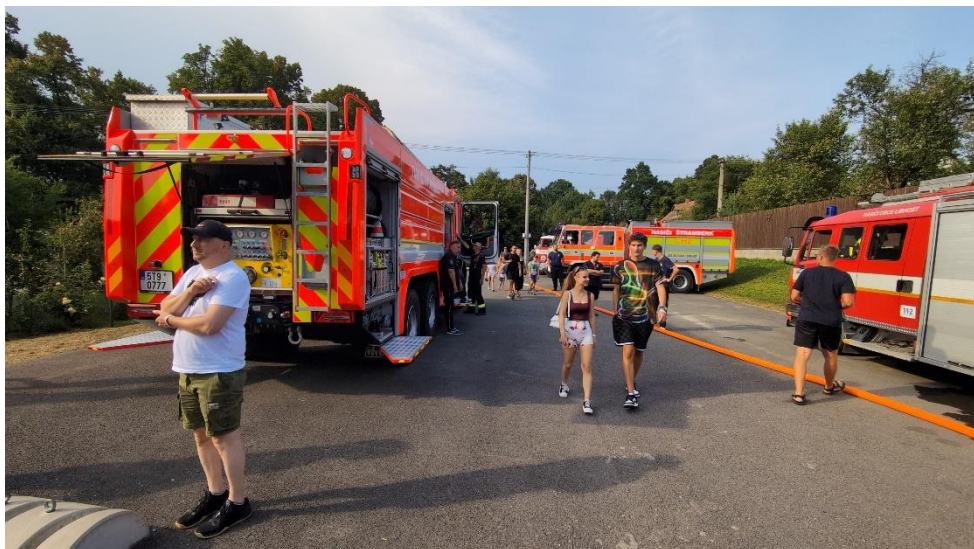
Hasičská technika na sportovním areálu