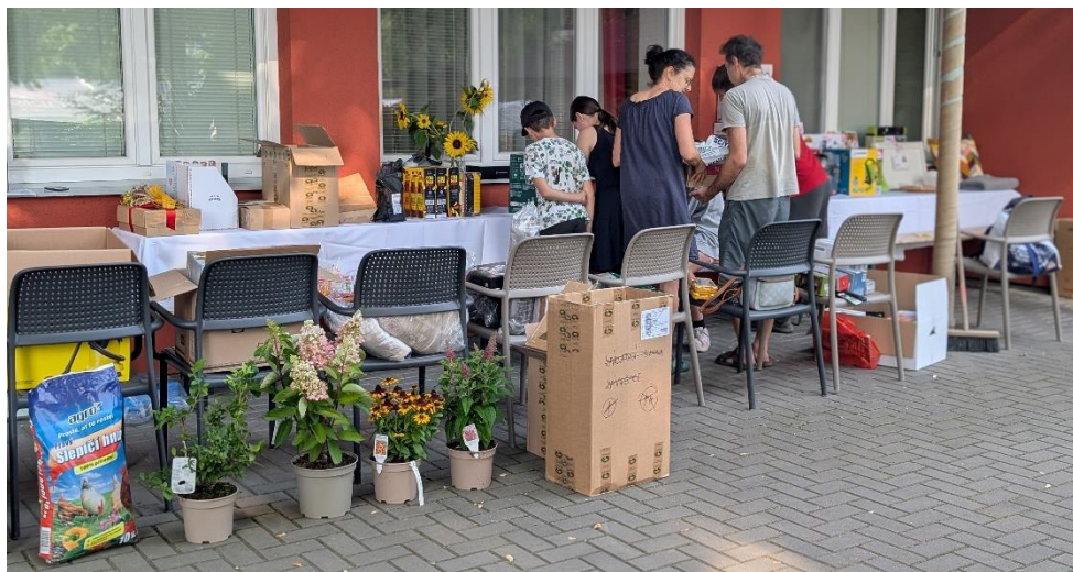
Příprava tomboly – aby každý lístek našel svého výherce