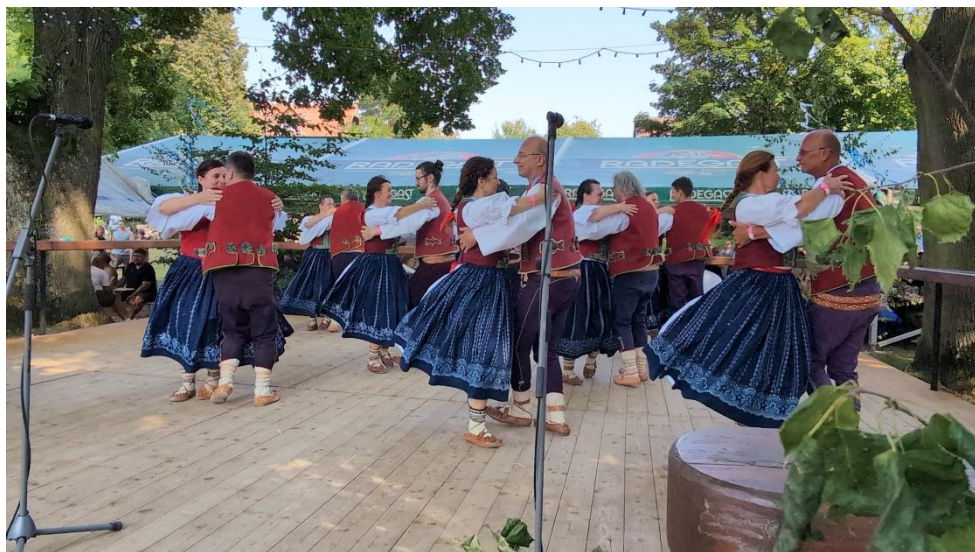
Taneční vystoupení Valašského souboru Sedmikvítek