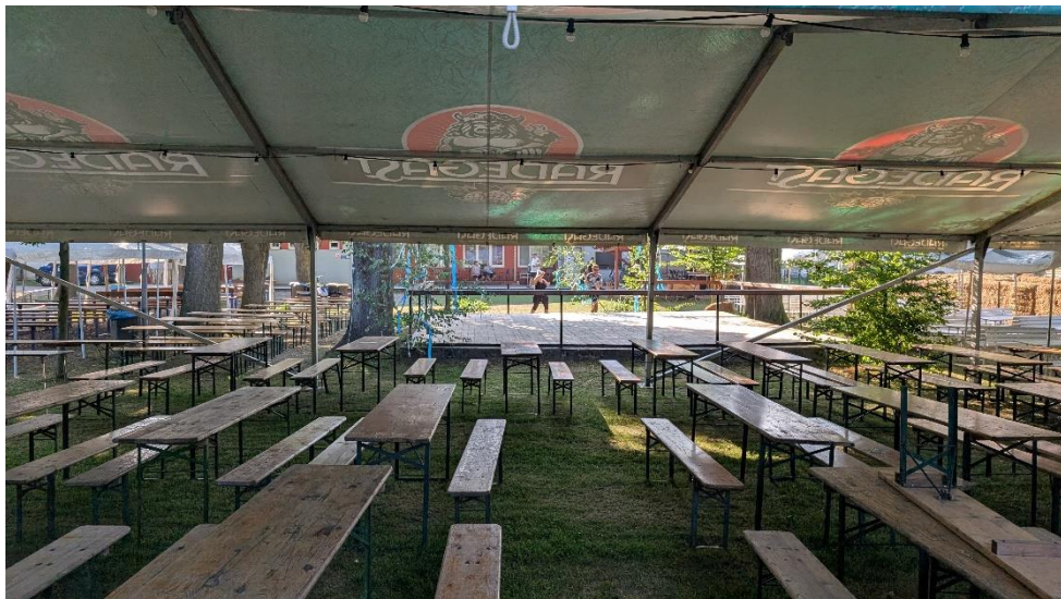
Stany a lavičky jsou nachystány pro naše hosty