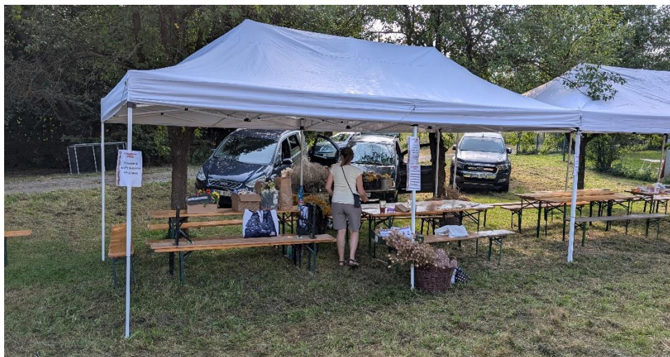
Zázemí pro aktivity na louce