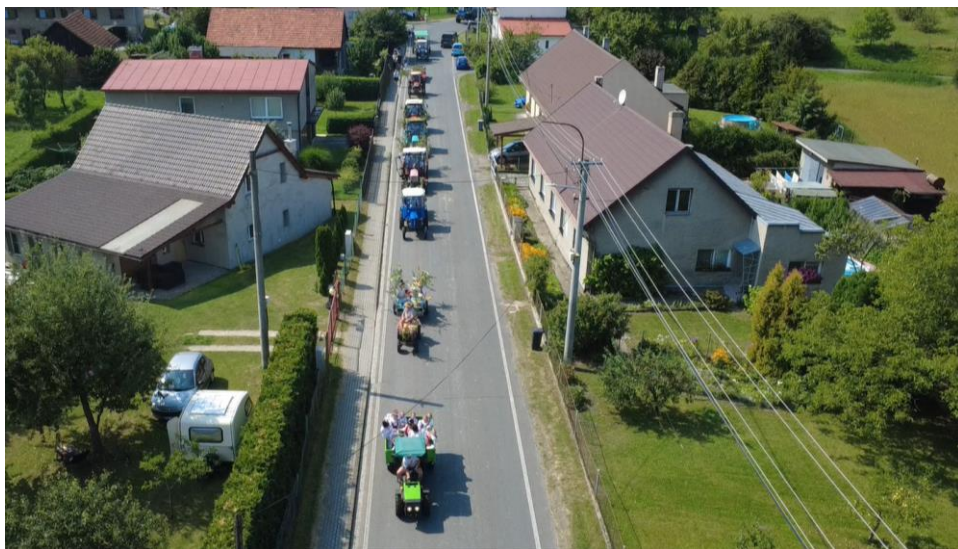
A průvod vychází - pohled z ptačí perspektivy