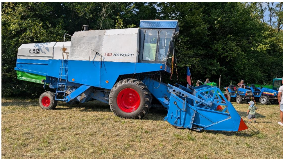
Zemědělská technika na louce