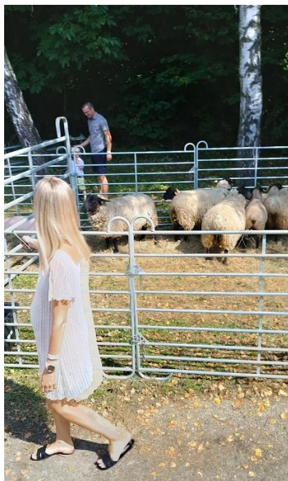
Výstavka hospodářských zvířat