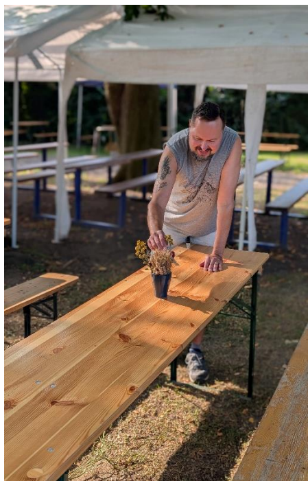
Květinová výzdoba na stolech