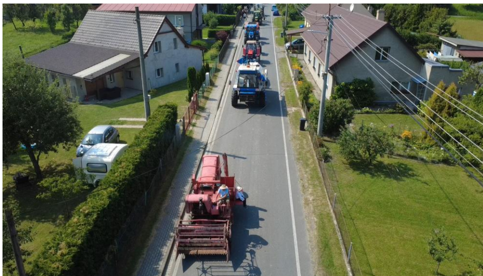
Průvod z ptačí perspektivy