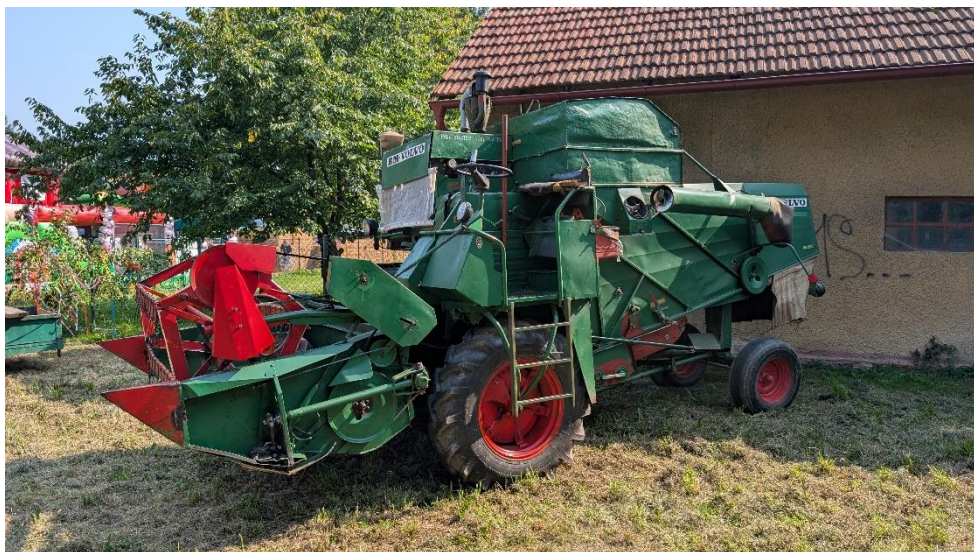
Zemědělská technika na louce