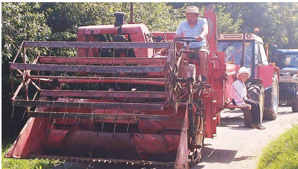
Nastartovat kombajn a můžeme vyrazit do průvodu