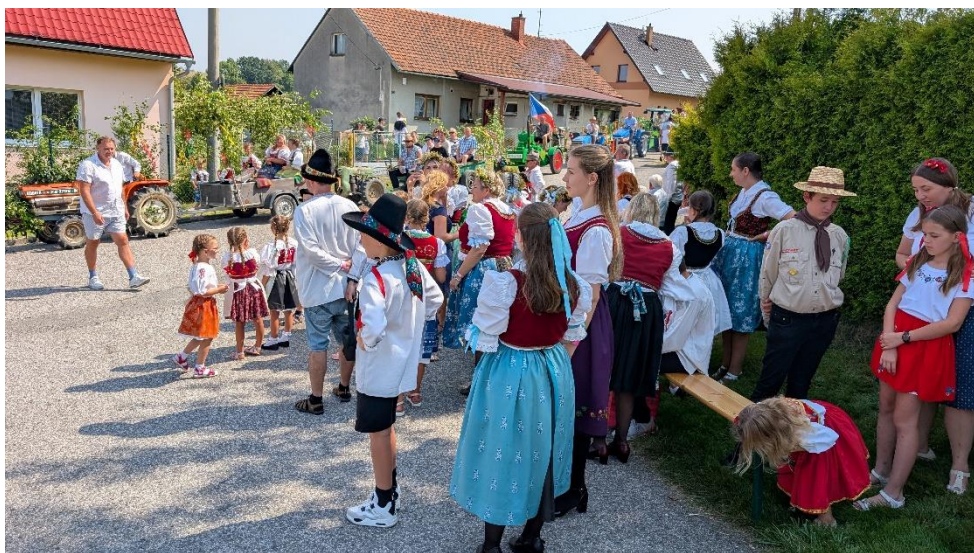
Krojování již netrpělivě vyhlíží start průvodu