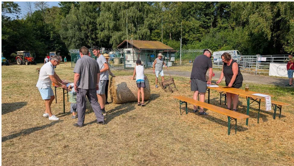
Soutěže na louce – válení balíků slámy a jízda s trakařem