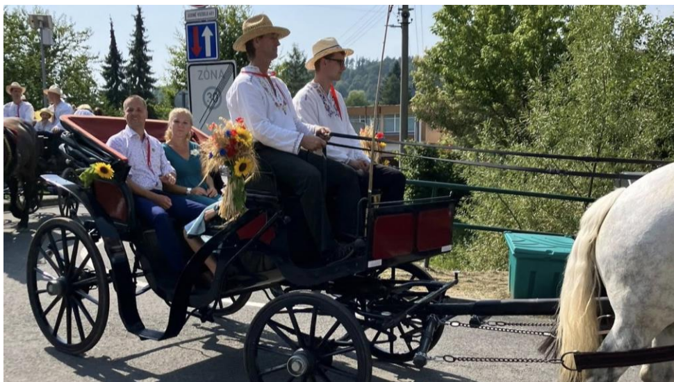
Kočár se starostou