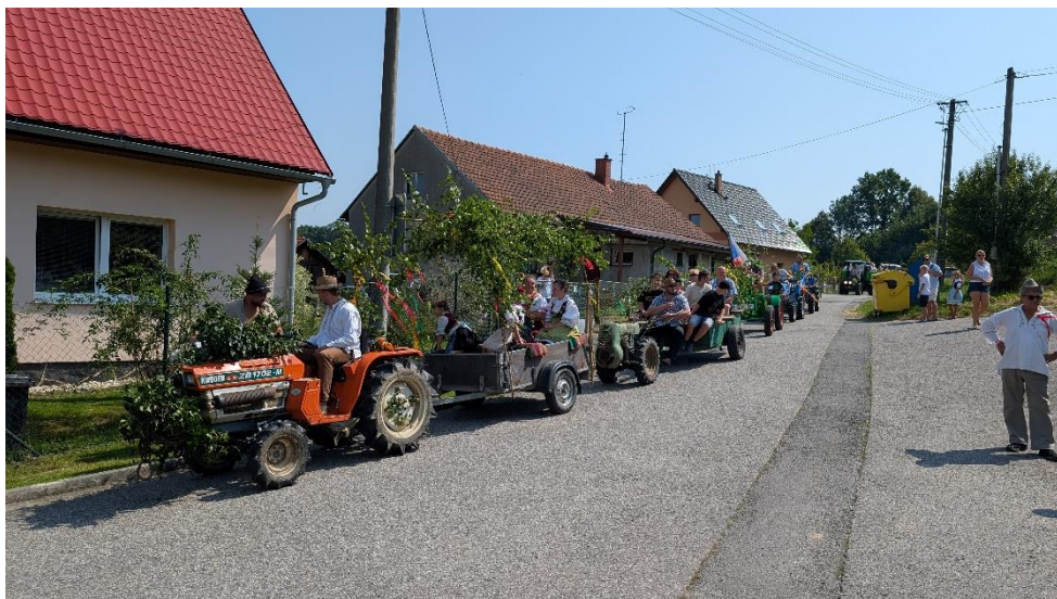
Seřazení zemědělské techniky