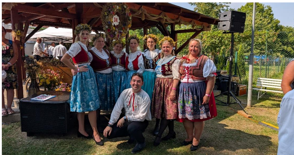
Komise pro děti a mládež s dožínkovým věncem