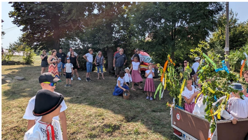
Sraz zemědělské techniky na statku