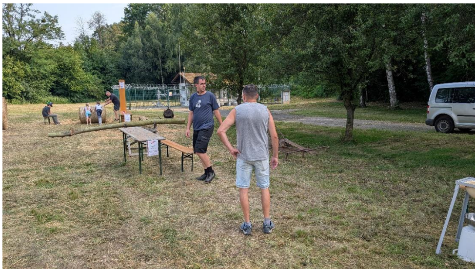
Příprava sportovního ducha na louce