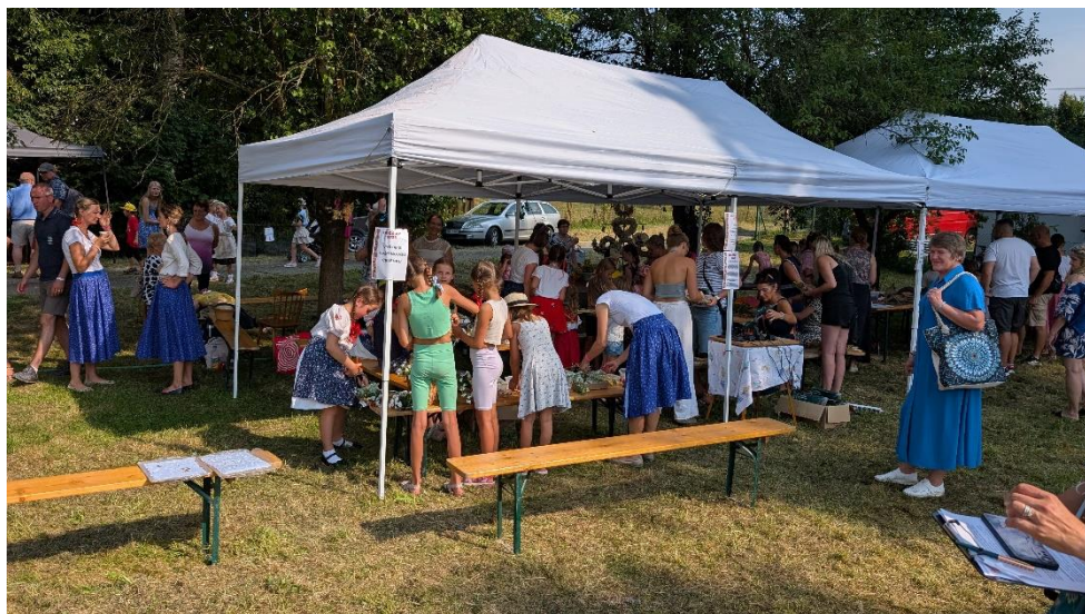
Aktivity na louce