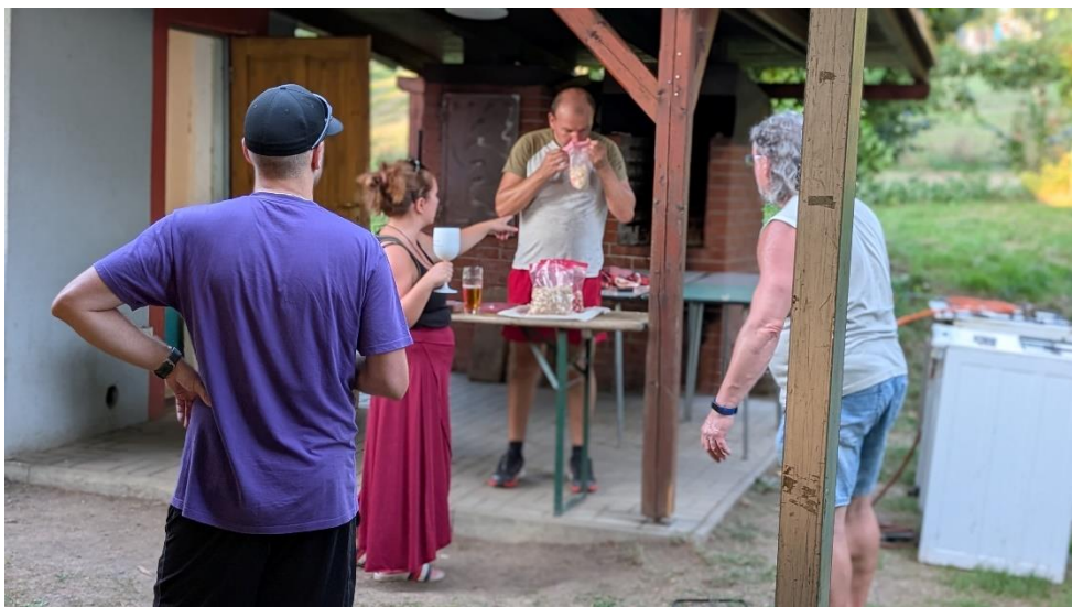
Hasiči loupou česnek na bramborové placky