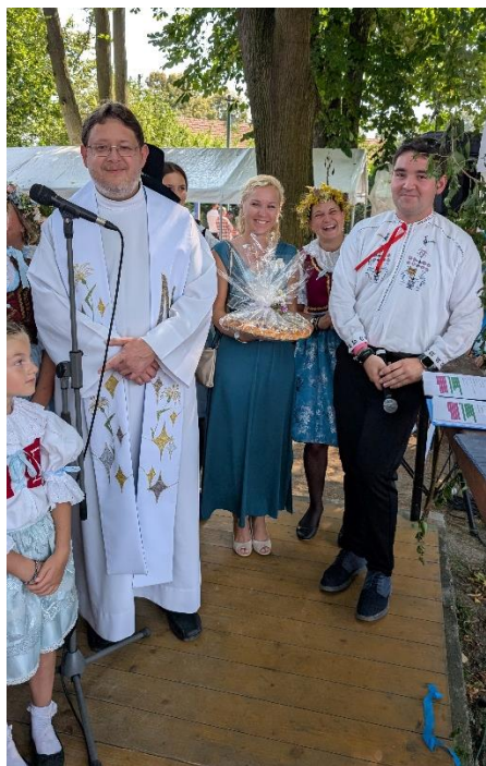
Posvěcení dožínkového věnce