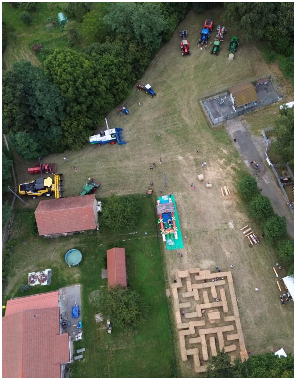
Pohled na bludiště z ptačí perspektivy