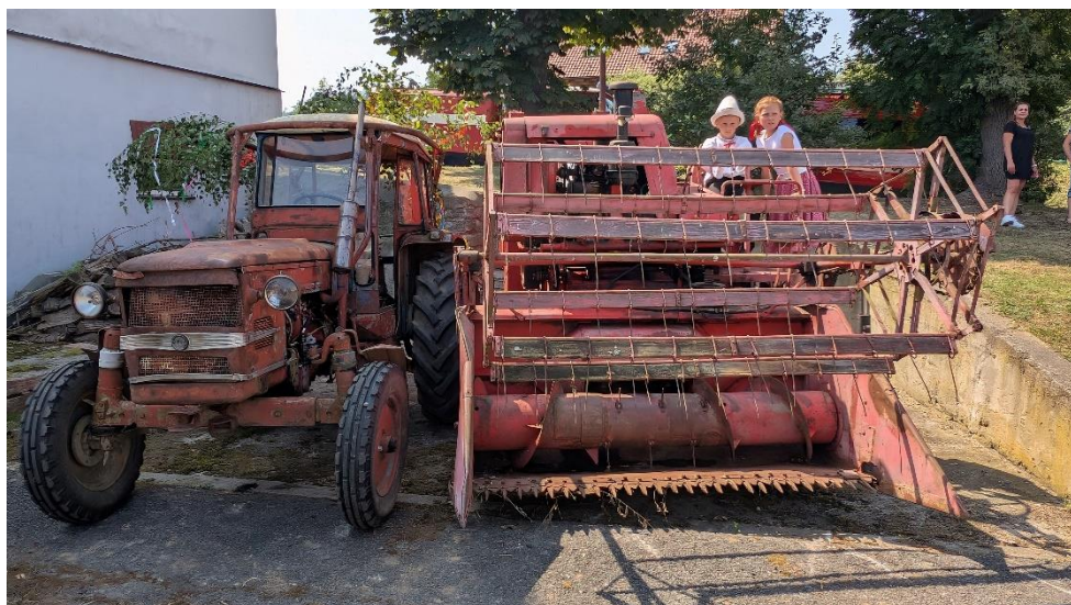
Sraz zemědělské techniky na statku