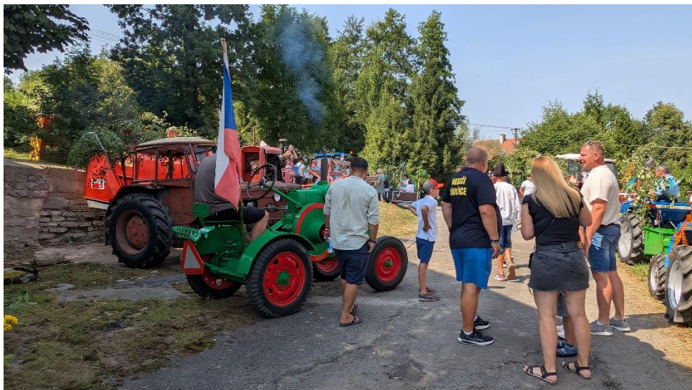
Sraz zemědělské techniky na statku