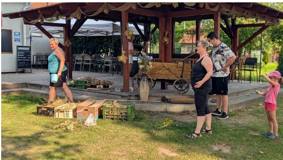
Výzdoba altánu U Kremlí