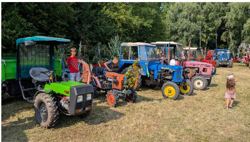
Zemědělská technika na louce