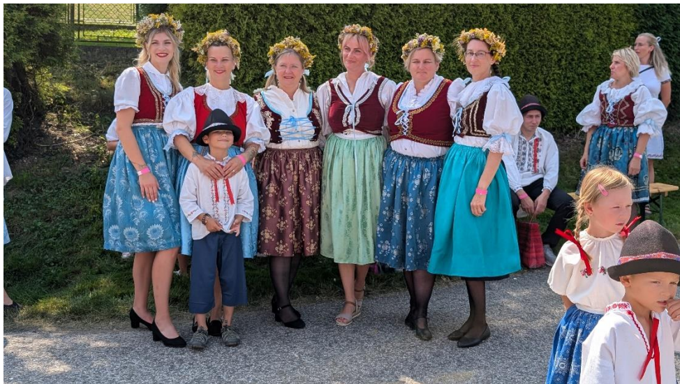
Ještě jedno společné foto – děvčatům to sluší!