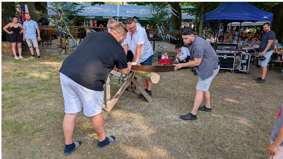
Soutěže před publikem – řezání dřeva