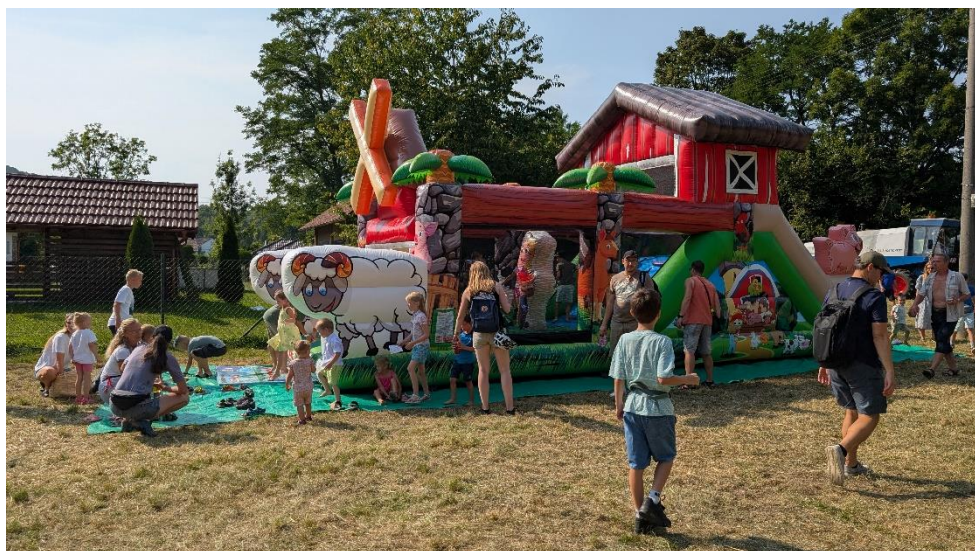
Děti si užívají skákací hrad