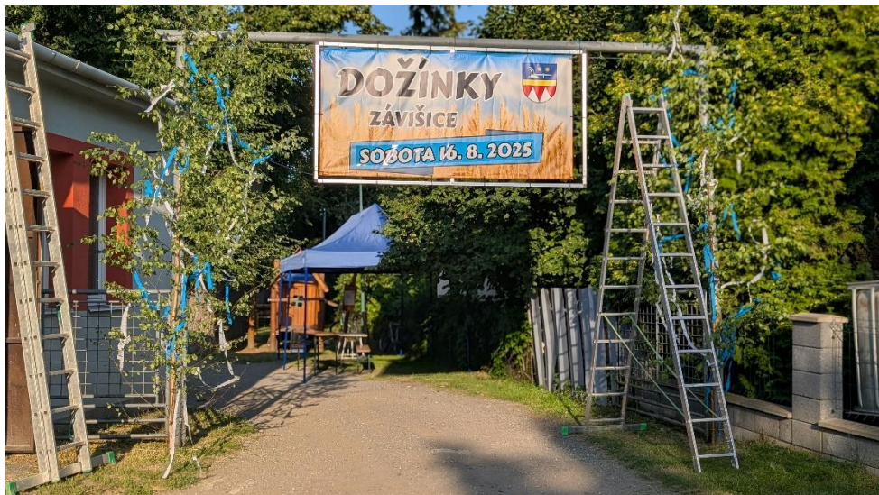
Uvítací banner při vstupu na výletišťe U Kremliů