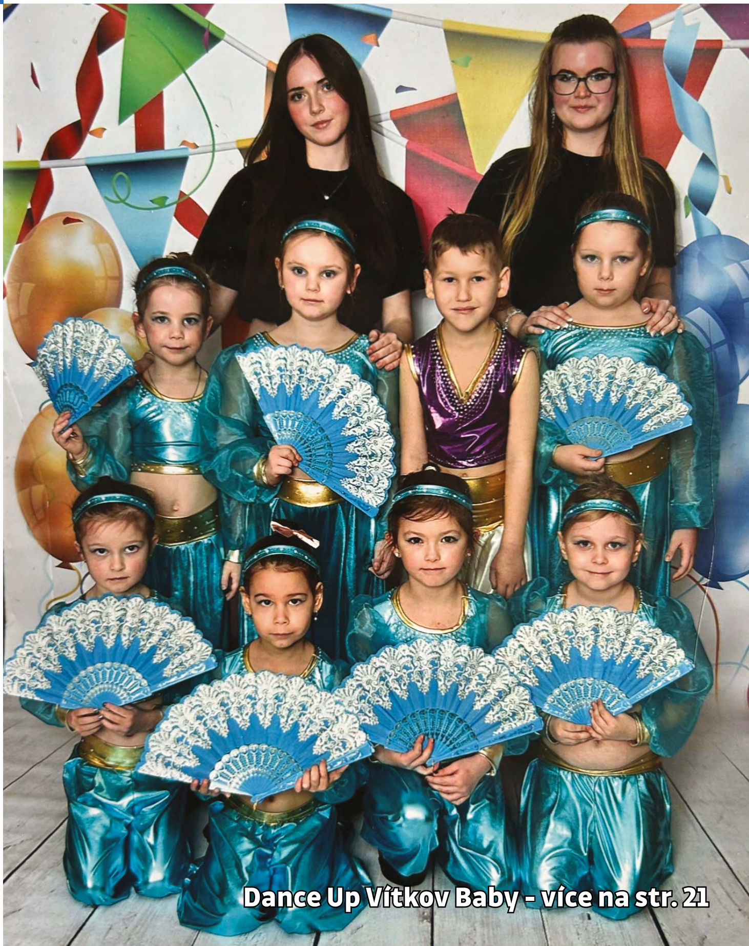
Dance Up Vítkov Baby - více na str. 21