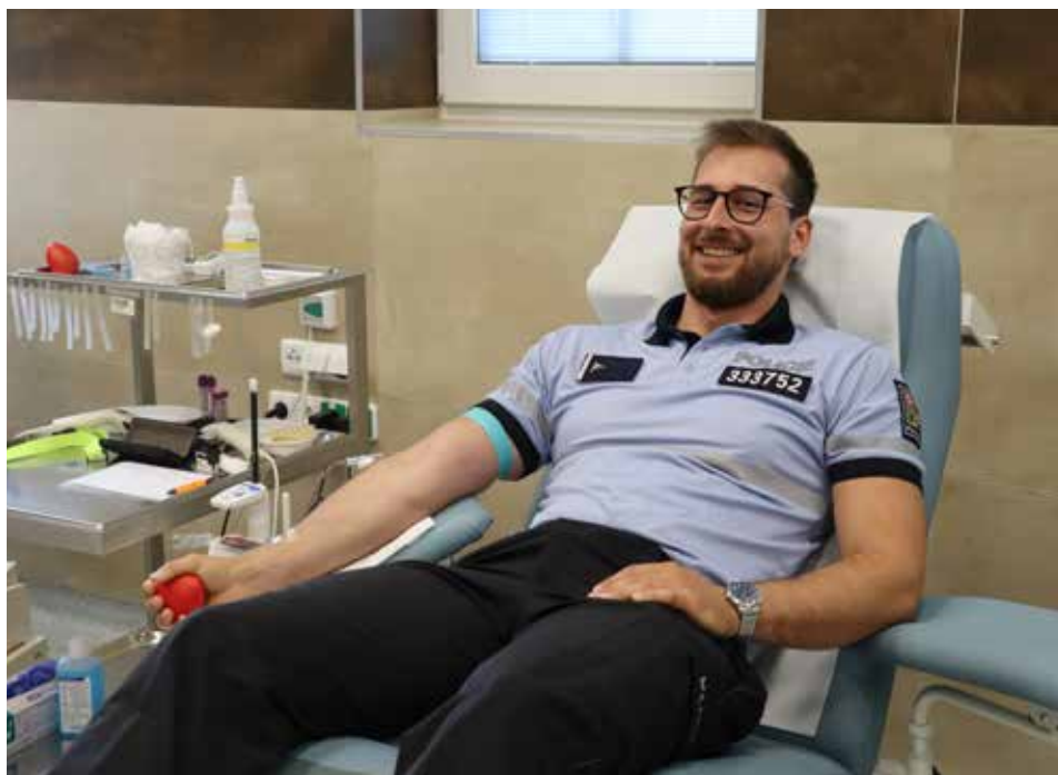
Do loňské dárcovské kampaně města a přerovské nemocnice se mimo jiné zapojili i policisté