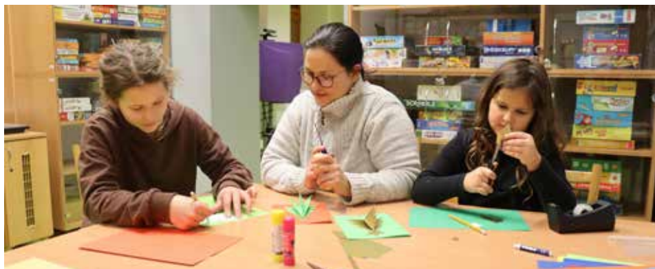
Půjčovna pro děti chystá pro malé čtenáře i různé tvořivé dílničky

Zábavu pro děti, přednášky i tvořivé dílny pro dospělé, den otevřených dveří, seminář pro knihovníky a vzdělávání seniorů – v knihovně se v novém roce zahálet určitě nebude. Čtenáři se mohou těšit i na tradiční akce, jako je Noc s Andersenem nebo Noc literatury.