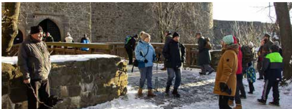
Novoroční výstup na Helfštýn každoročně přiláká stovky návštěvníků

Pro návštěvníky bude připraven i nový tematický kapesní kalendář s přehledem akcí pro nadcházející sezonu, který bude zdarma k dispozici v pokladně a během roku také v hradním obchodě či některých informačních centrech.