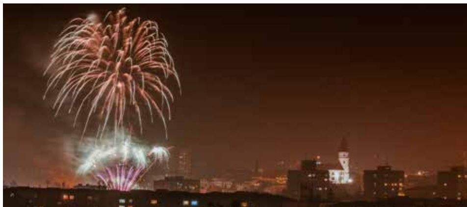
Novoroční ohňostroj mohou lidé sledovat nejen z břehů Bečvy – takto jej vloni zachytil přerovský fotograf Ivan Nevtil

Petardy v Přerově končí – a nejen ony. Na území města platí od ledna celoroční zákaz odpalování pyrotechnických výrobků a provádění ohňostrojů. Nová obecně závazná vyhláška, kterou v prosinci schválili zastupitelé, reaguje na legislativní změny v zákoně o pyrotechnice.