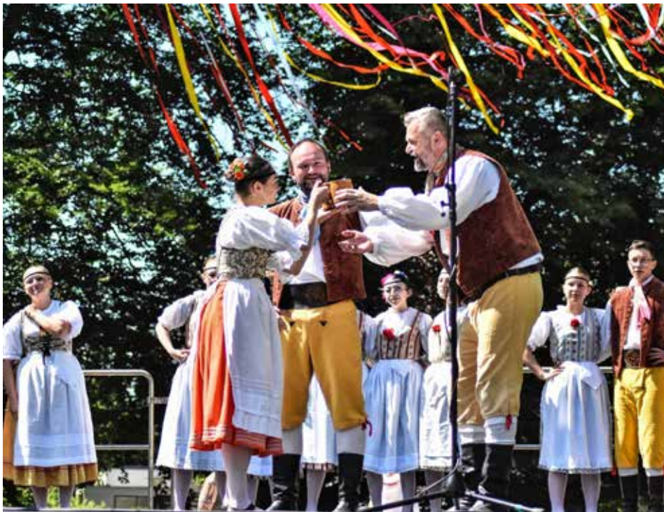
Folklorní festival se loni konal v malebném prostředí městského parku Michalov