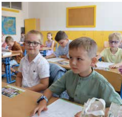
Školu navštěvuje kolem 600 žáků