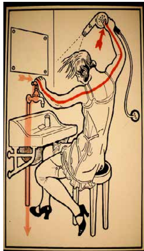
Na nebezpečí úrazů elektrickým proudem Jellinek upozorňoval ilustracemi v knize Ochrana před elektrickým proudem ve 132 obrazech