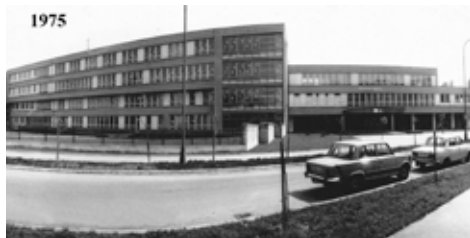
Takto vypadala budova základní školy U Tenisu v roce 1975

Základní škola U Tenisu slaví padesát let od svého otevření. Jubileum doprovází série akcí, mezi nimi i Turistická padesátka, která připomíná historii školy i její současné zaměření na pohyb, sport a aktivní život.