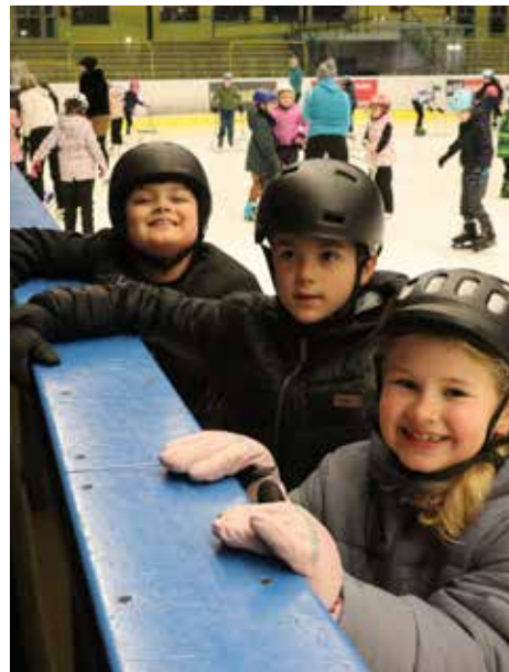
V příštím roce nezdraží ani bruslení veřejnosti na zimním stadionu

Ani ceny v kulturních zařízeních se nemění. „Žádné velké zdražení neplánujeme, ceny vstupného do kina Hvězda, na představení či koncerty v Městském domě ponecháme na stejné úrovni jako