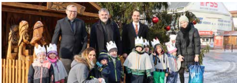
Malí koledníci každoročně navštíví i radnici

Skupinky koledníků se začátkem ledna znovu vydají na cesty, aby koledou přinesly radost i naději do všech domácností. V Přerově a okolí vyjdou Kašpar, Melichar a Baltazar do ulic mezi 1. a 14. lednem. V samotném městě budou k vidění 9. a 11. ledna, v Předmostí se objeví už 4. ledna.