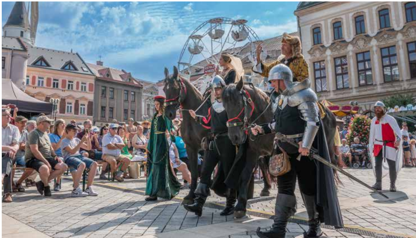
Na srpnové Svatovavřínecké hody dorazí i král Přemysl Otakar II.

Sedm století a sedm desítek let uplynulo od chvíle, kdy Přemysl Otakar II. vtiskl Přerovu královskou pečeť. Roku 1256 se z prostého sídla stalo město, které neslo hrdý titul královské. Od té doby se tu psaly dějiny – v příbězích i v lidských osudech. Rok 2026 bude připomínkou této chvíle, město se proto rozezní hudbou, slavnostmi a výstavami.