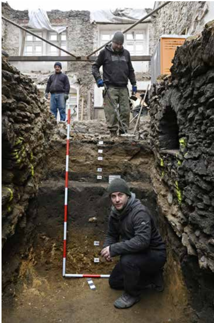
Horní náměstí č.p. 25. Archeologové Muzea Komenského během výzkumu

jeho pravomoci a pravomoci městského soudu. Z oblasti práv hospodářských můžeme předpokládat uplatňování práva mílového a máme doloženo udělení výročního trhu v roce 1355. Z oblasti majetkového práva musíme zmínit právo odúmrti z roku 1386, podle nějž majetek po zemřelém získávali jeho dědicové, a ne jako doposud zeměpán,“ vyjmenoval Lapáček.