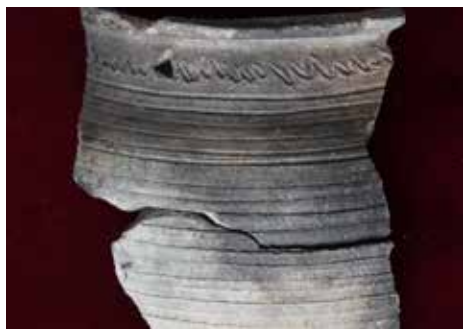
Nalezené fragmenty keramické nádoby

Dvůr bývalého Emosu, dnes procházejícího rekonstrukcí na novou budovu magistrátu, se nachází na levém břehu