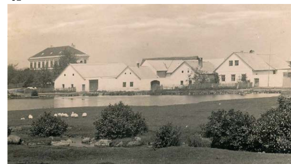
Jeden z „klasických“ peršláckých pohledů od loučky s dnešním dětským hřištěm přes Návesní rybník směrem na bývalou německou školu – dnes penzion Medvědí Paseka - se od konce 30. let XX. století, kdy byla fotografie pořízena, změnil (opět kromě rozsahu vzrostlé zeleně) jen minimálně. Dnes je zbořeno levé křídlo a brána statku č.p. 34 a chybí také rozsáhlé hospodářské objekty a stodoly v zadním plánu zástavby. Nová okna, zakončená obloučky, dostala s přestavbou na penzion budova bývalé školy. Jinak u rybníka panuje podobná idylka jako dnes – jen místo dětí oživená hejnem husl...