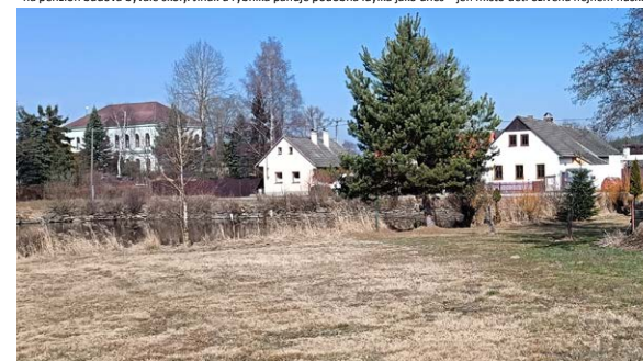
Ukázka z výstavy Proměny Peršláku 2026.