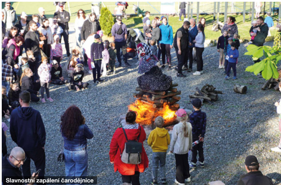
Slavnostní zapálení čarodějnice