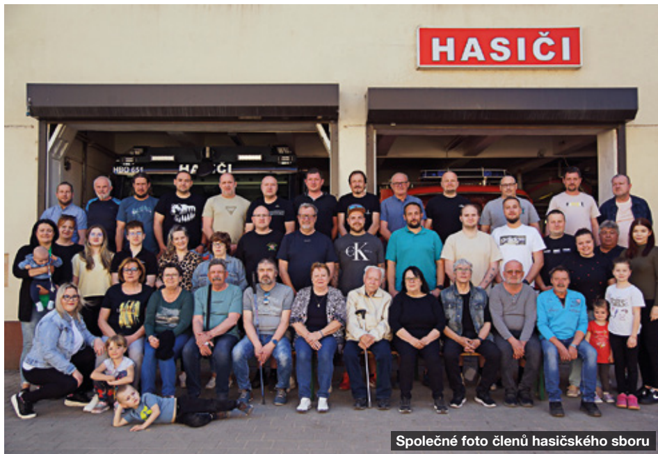
Společné foto členů hasičského sboru

Po oficiálním slavnostním nástupu následovaly ukázky různých odvětví hasičské činnosti. Hasiči z Nových Bránic se svou historickou stříkačkou nám svým typickým humorným pojetím předvedli hašení hořící hospody,