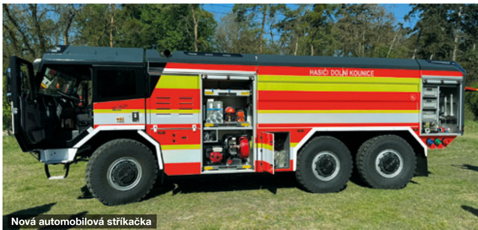
Nová automobilová stříkačka

Naším hasičům děkujeme za ochranu našich životů i majetku a přejí jim, aby se po každém výjezdu s novou CAS vždy v pořádku vrátili ke svým rodinám domů.