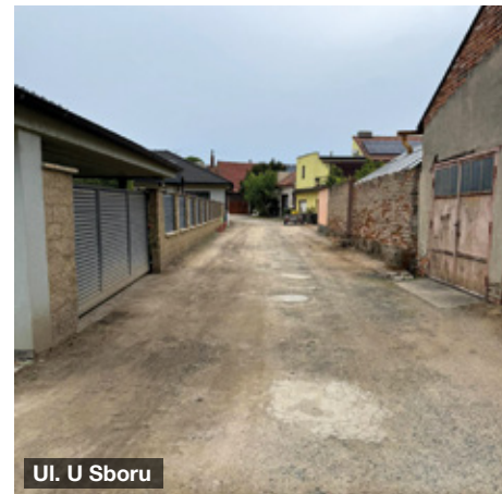
Ul. U Sboru

Děkujeme za pochopení a trpělivost po dobu realizace této investice, která přispěje ke zkvalitnění veřejného prostoru.