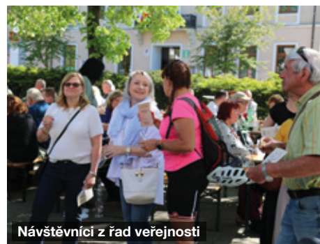
Návštěvníci z řad veřejnosti