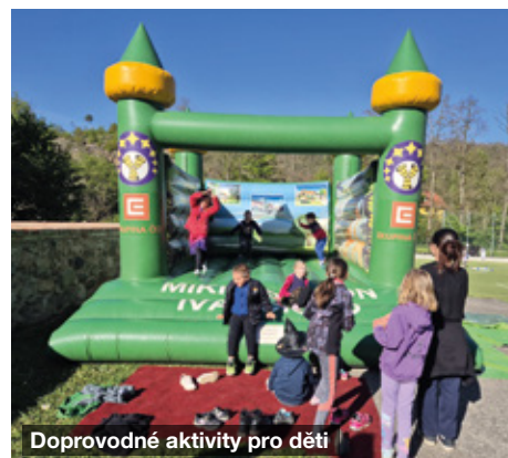
Doprovodné aktivity pro děti