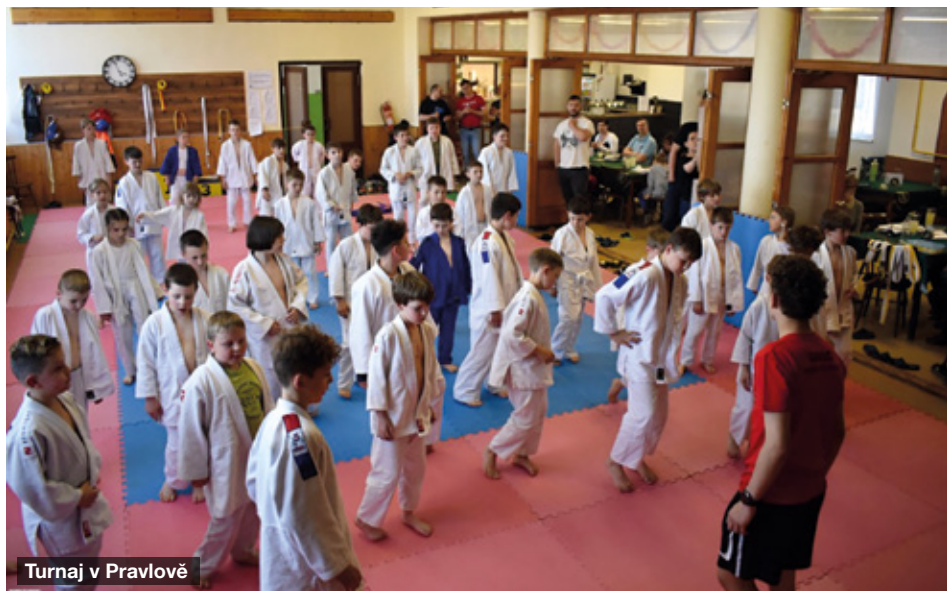
Turnaj v Pravlově