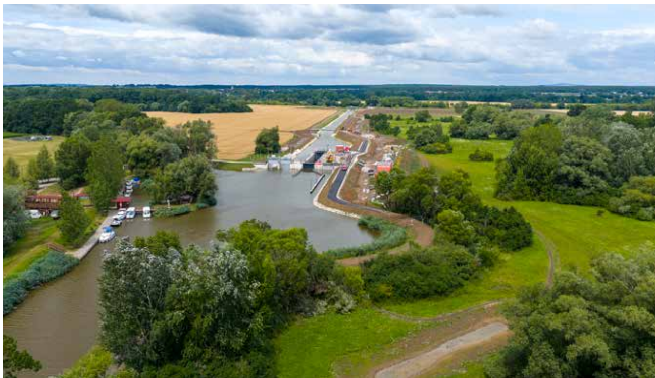
Plavební komora Rohatec–Sudoměřice spolu s upraveným tokem Radějovky

S letošním zahájením plavební sezony se 1. května otevře také nová plavební komora Rohatec/Sudoměřice spolu s upraveným tokem Radějovky, kterou společně realizovaly společnosti SWIETELSKY stavební a Metrostav DIZ. Tato stavba je pro Hodonínsko důležitá, protože prodlužuje splavnost Bařova kanálu až do Hodonína a otevírá nové možnosti pro cestovní ruch, služby i další navazující aktivity. Otevření plavební sezony bude letos spojeno také se slavnostním programem přímo u komory, kam srdečně zveme všechny návštěvníky.